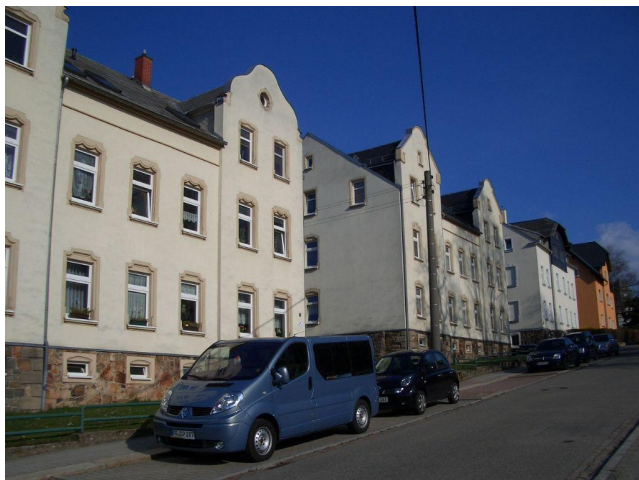
entlang der Straße

Das Angebot ist freibleibend und unverbindlich.